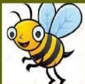
"El vuelo del abejorro" Rimski-Korsakov