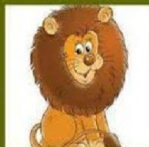
El León "El carnaval de los animales" C. Saint-Saëns