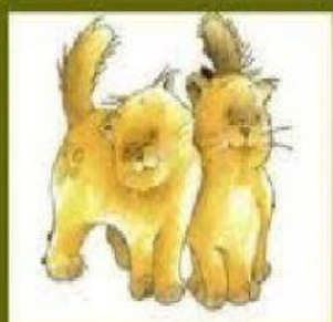
"El dueto de los gatos" G. Rossini