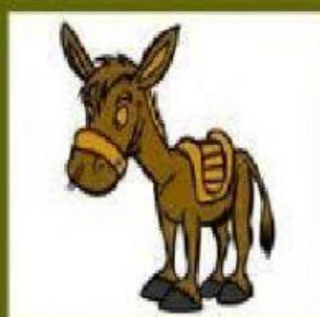
Asnos salvajes "El carnaval de los animales" C. Saint-Saëns