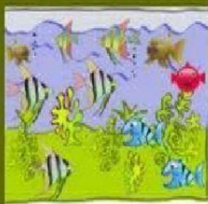
Acuario "El carnaval de los animales" C. Saint-Saëns