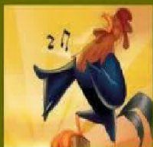
"Preludio al gallo mañanero" J. Rodrigo