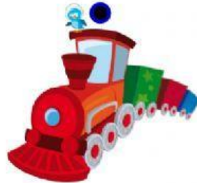
T R E N