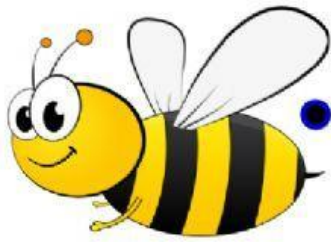
A B E J A

UNE CON FLECHA EL DIBUJO QUE EMPIECE POR A CON LA LETRA BUSCA Y PICA DÓNDE ESTÁN TODAS LAS A