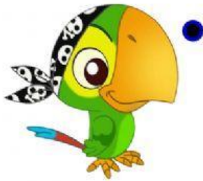
L O R O