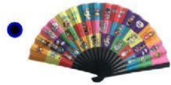
A B A N I C O