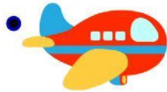
A V I Ó N