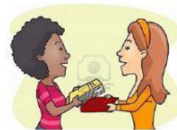
Devolver lo que no es mío.