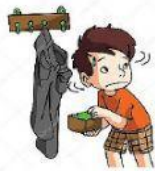
Tomar lo ajeno