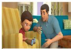
Contar la verdad.