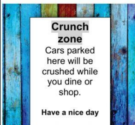
Imagem para as questões 2 e 3