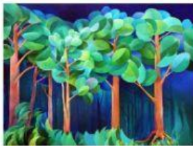
BOSQUE DE GULUBÚ