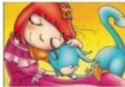
MONILDA Y GATOPATO