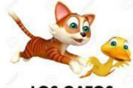
LOS GATOS Y LOS PATOS