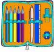
das Mäppchen/ die Mäppchen