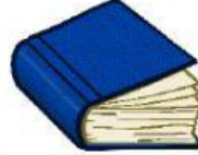
das Buch/ die Bücher