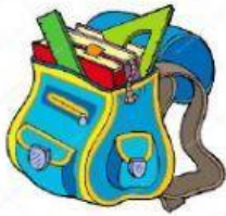
die Schultasche/ die Schultaschen