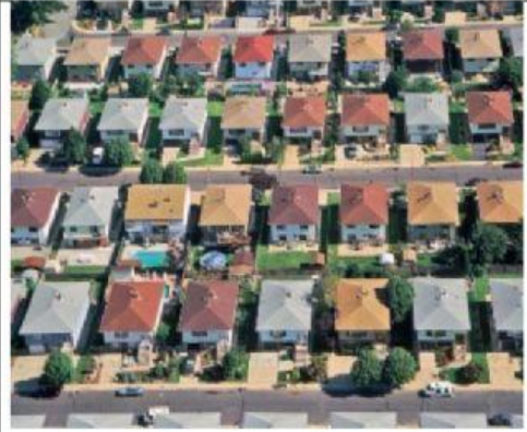
Une banlieue pavillonnaire dans le New-Jersey.

Logements destinés aux populations pauvres. Considéré comme un ghetto (quartier pauvre qui regroupe les populations d'une même origine) Aujourd'hui, ce quartier change, la violence baisse et les classes moyennes s'y installent de plus en plus.