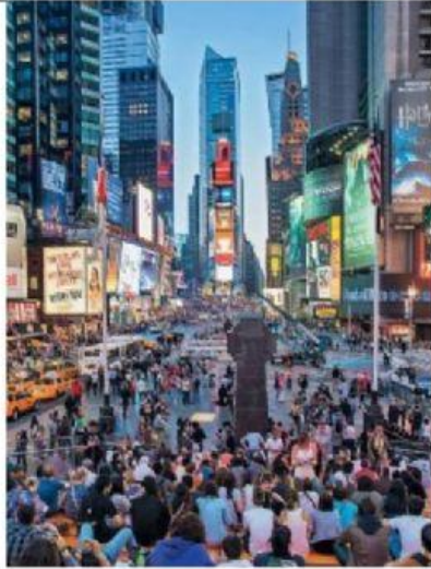
Times Square à Manhattan.

365 000 personnes s'y croisent chaque jour, quartier très animé.