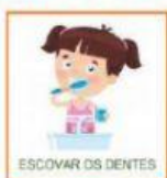
ESCOVAR OS DENTES