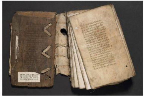
quaterniones o cuadernos de la época.