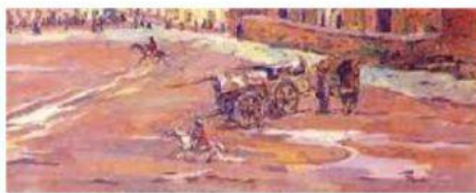
CALLE DE BARRO