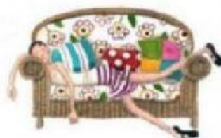
TRABALHA MUITO E CHEGA CANSADA