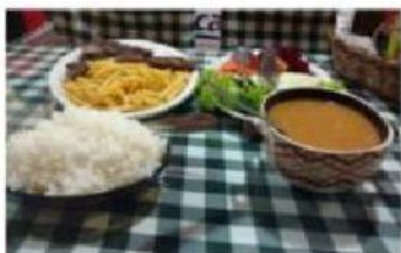
ARROZ E FEIJÃO

4- SUA MÃE GOSTA DE COZINHAR? QUAL DESSES PRATOS VOCÊ GOSTARIA QUE SUA MÃE PREPARASSE PARA VOCÊ?