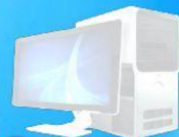
Computadora de Escritorio