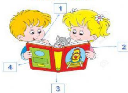
Partes del libro