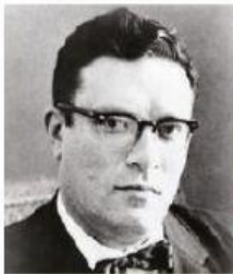
Isaac Asimov (Rusia, 1920 Estados Unidos, 1992)