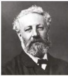
Julio Verne (Francia, 1828 - 1905)