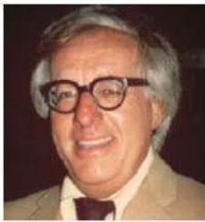
Ray Bradbury (Estados Unidos, 1920 - 2012)