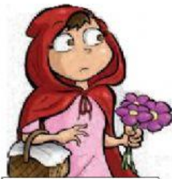
Versión de Caperucita

Te invito a que vuelvas a escuchar los testimonios de Caperucita y el Lobo Feroz. Clickea en cada personaje para recordar su versión de los hechos. Si ya los recuerdas continúa con las consignas.