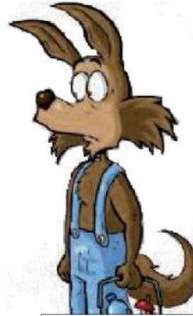
Versión del Lobo Feroz