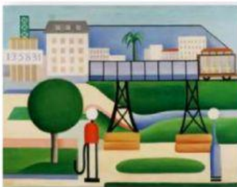
São Paulo (1924)

2 - Observe as obras de Tarsila do Amaral e escreva se a pintura retrata a Zona Rural ou Urbana.