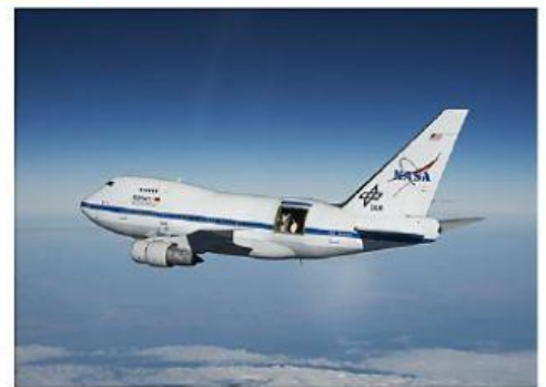
OBSERVATORIO CON BASE EN EL AIRE - SOFIA ,NASA