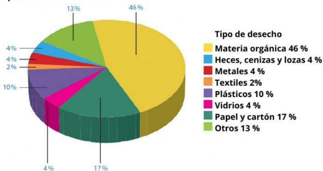
Composición de la basura domiciliar.

• ¿Qué tipo de residuo se produce en mayor cantidad?