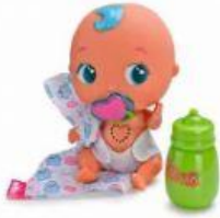
Muñeca Bellie 29,54 €

1. Ordena de MAYOR a MENOR los precios de estos juguetes: