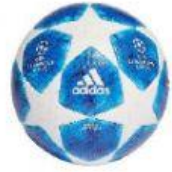
Balón 21,86 €