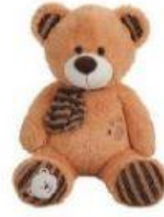
Oso de peluche 5,83 €