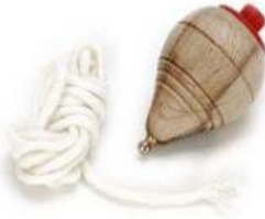
Peonza 5,75 €