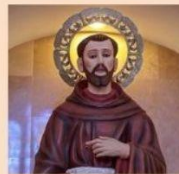
San Francisco de Asís.