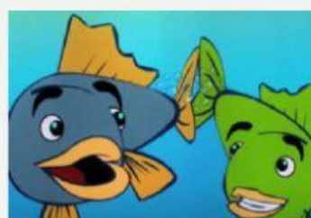
Aplaudir (To clap)