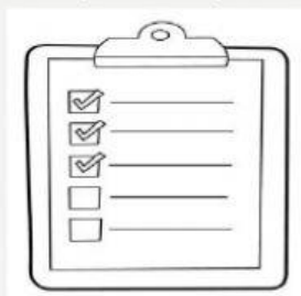
La lista (The list)