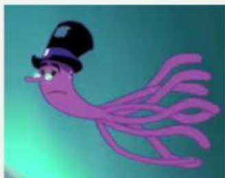
El pulpo (Octopus)