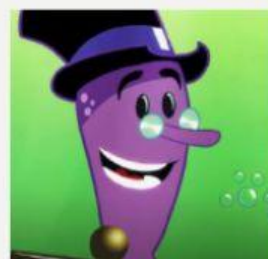
Cantar (To sing)