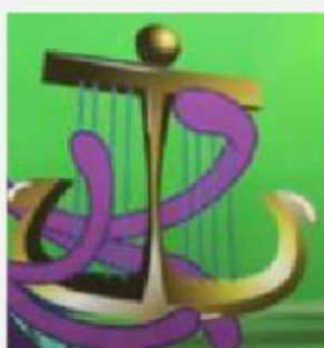
Arpa dorada (Golden harp)