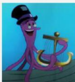
Tocar (To play)