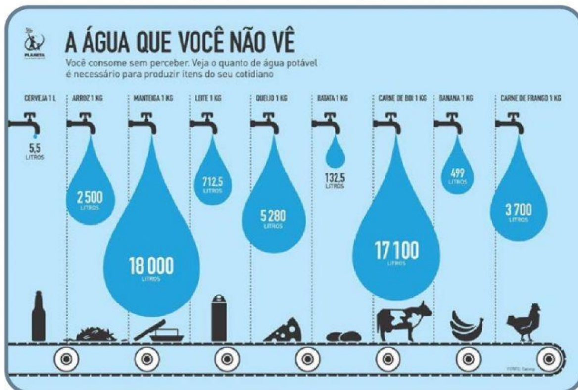
Figura 5 – Consumo de água em alguns produtos dentro da agropecuária