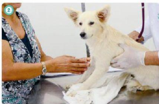
CACHORRO SENDO EXAMINADO EM HOSPITAL VETERINÁRIO, EM RECIFE (PERNAMBUCO), 2017.

MARQUE COM UM X ALGUNS CUIDADOS QUE DEVEMOS TER COM OS ANIMAIS DE ESTIMAÇÃO.