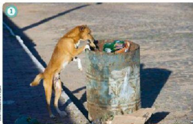
CACHORRO PROCURANDO COMIDA EM TAMBOR DE LIXO, EM MARAU (BAHIA), 2014.

VOCÊ LEMBRA DAS FOTOS DA ATIVIDADE DE ONTEM?