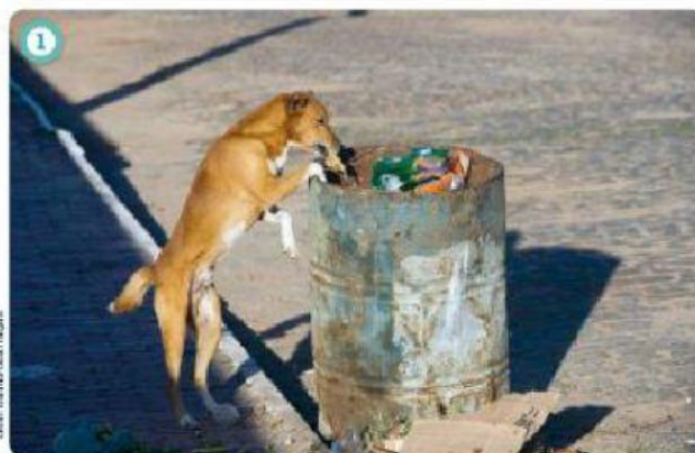
CACHORRO PROCURANDO COMIDA EM TAMBOR DE LIXO, EM MARAUÍ (BAHIA), 2014.

VOCÊ TEM ALGUM ANIMAL DE ESTIMAÇÃO OU CONHECE ALGUÉM QUE TENHA? QUE CUIDADOS ESSE ANIMAL RECEBE? VEJA OS ANIMAIS DAS FOTOGRAFIAS ABAIXO: