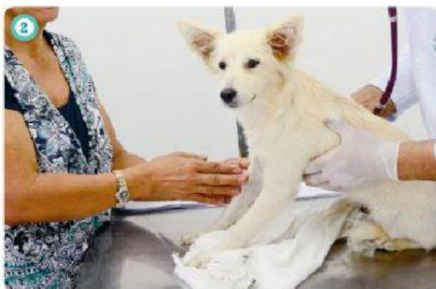
CACHORRO SENDO EXAMINADO EM HOSPITAL VETERINÁRIO, EM RECIFE (PERNAMBUCO), 2017.

O QUE VOCÊ OBSERVA NA FOTOGRAFIA NÚMERO 1?