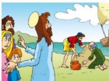
Jesús se encontraba en el Mar