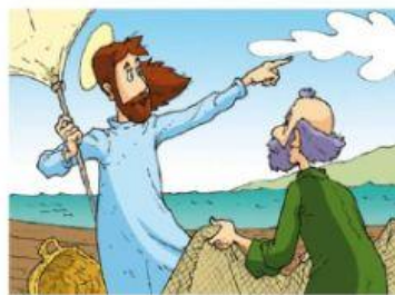
Jesús subió a la barca de