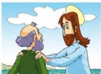
Jesús le anima y le propone ser