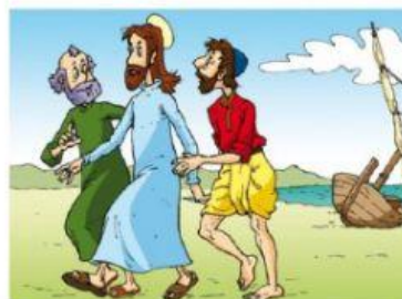
Este grupo que a partir de ahora va a seguir siempre a Jesús, se llaman