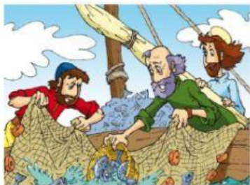
Simón no quería pescar porque