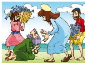
Simón reconoce a Jesús y le pide que se aleje de él porque es