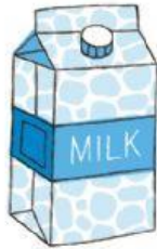
Un bote de leche