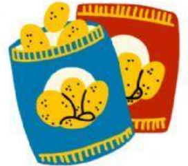
Paquete de papas