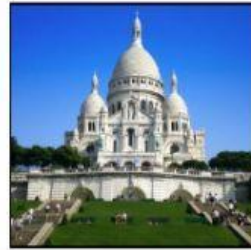
Le Sacré Cœur