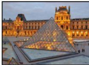
Le musée du Louvre