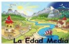
La Edad Media