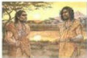
Vestían pieles y fibras vegetales