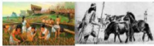
Descubrimiento de la agricultura ( cultivan cereales y legumbres ) y ganadería ( domestican algunos animales )