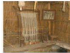
Empiezan a elaborar tejidos como el lino, cáñamo o esparto. Inicio del uso de telares