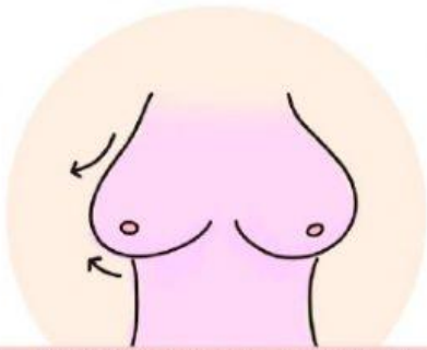
#4 CRECIMIENTO DE SENOS