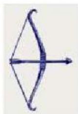
ARCO E FLECHA

d) SELECIONE AS ARMAS QUE OS ÍNDIOS UTILIZAM PARA CAÇAR: