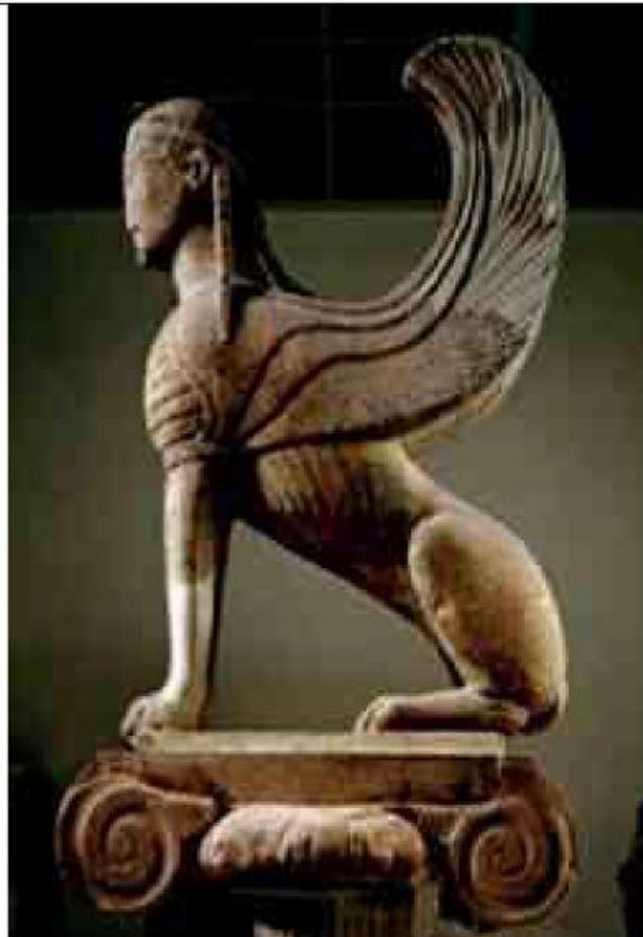
Esfinge de Naxos, Delglos, Gécia, c 560 aC

Você já parou para pensar que importância tem a palavra na vida e no nosso dia a dia? Você já parou para imaginar a força que ela tem? Como é usada para ensinar, construir, destruir, enganar, mascarar, separar, reunir? As palavras têm dono? São livres? São domáveis? São fáceis ou difíceis? As palavras condenam ou absolvem? Leia o texto a seguir para conhecer um enigma: