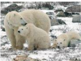
Oso polar: _____