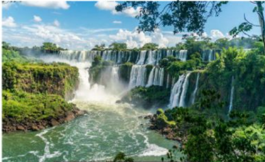
CATARATAS DO IGUAÇU