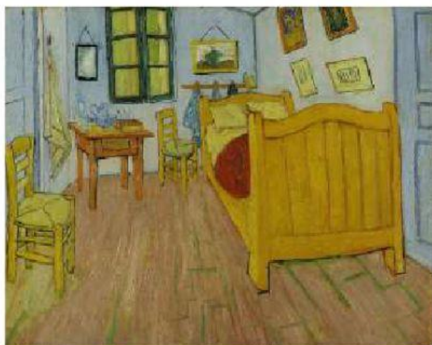
QUARTO EM ARLES (1ª VERSÃO, 1888)

01. OBSERVE AS IMAGENS ABAIXO, SÃO AS TRÊS VERSÕES DO QUARTO DE VAN GOGH: