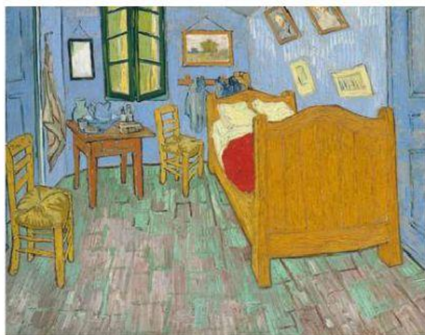
QUARTO EM ARLES (2ª VERSÃO, SETEMBRO 1889)