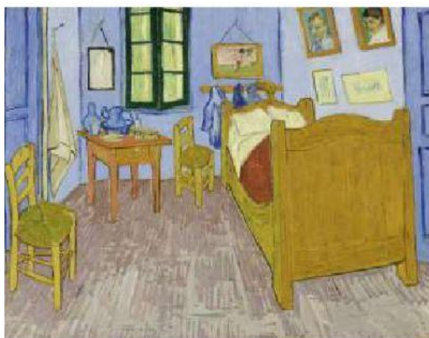
QUARTO EM ARLES (3ª VERSÃO) FINAL DE SETEMBRO DE 1889, MUSÉE D'ORSAY