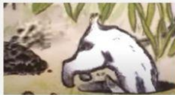
Excavar (To dig)