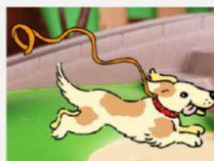
Escapar (To scape)