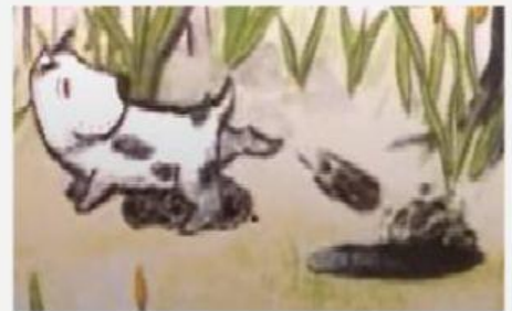
Enterrar (To bury)