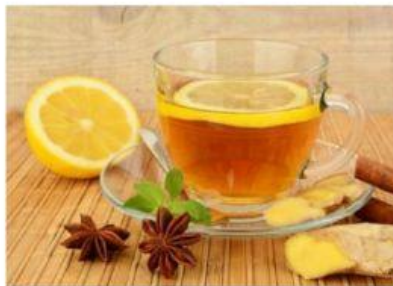
Agua de anís