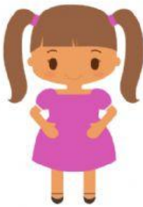
A NA LUIZA

CLIQUE EM CIMA DAS CRIANÇAS QUE OS NOMES TAMBÉM COMEÇAM COM A LETRA A.