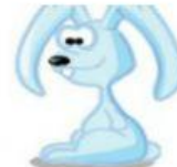
Rabbit – Coelho