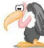
Vulture – Urubu