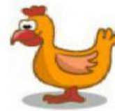
Hen – Galinha