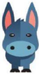
Donkey – Burro