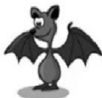
Bat – Morcego