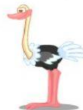
Ostrich – Avestruz