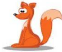
Fox – Raposa