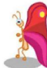
Butterfly – Borboleta