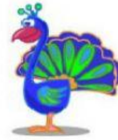
Peacock – Pavão