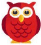
Owl – Coruja