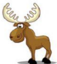
Moose – Alce