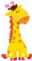
Giraffe – Girafa