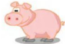
Pig – Porco