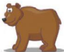
Bear – Urso