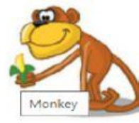
Monkey – Macaco