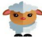
Sheep – Ovelha