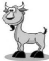
Goat – Bode