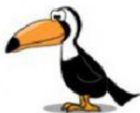
Toucan – Tucano