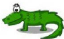
Alligator – Jacaré