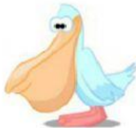
Pelican – Pelicano