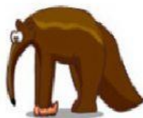
Anteater – Tamanduá