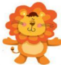
Lion – Leão