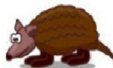
Armadillo – Tatu