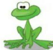
Frog – Sapo