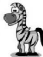
Zebra – Zebra