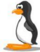
Penguin – Pinguim