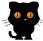
Panther – Pantera