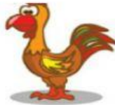
Rooster – Galo