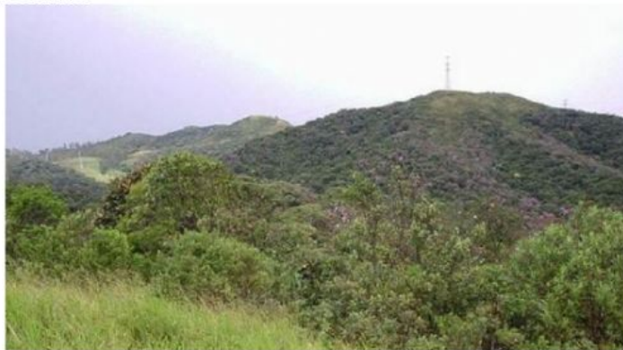
PICO DO BONILHA, BAIRRO MONTANHÃO