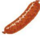
Wurst λουκάνικο, αλλαντικά