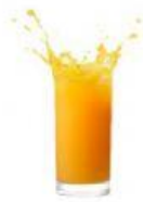
Orangensaft χυμός πορτοκάλι