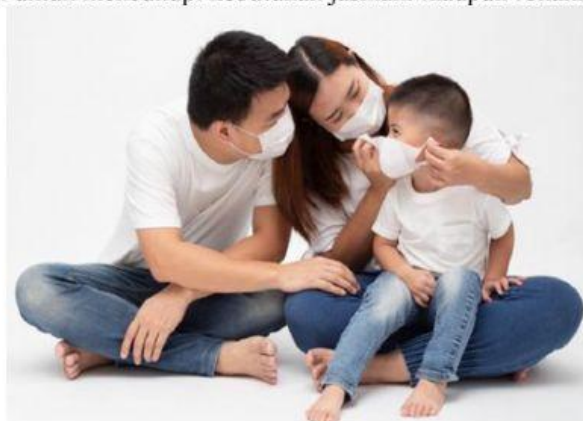
Gambar 1: Keluarga adalah simbol salah satu bentuk kelompok. Di dalam keluarga ini, kita dilahirkan dan dibesarkan

Sosiologi sebagai ilmu yang mempelajari tentang masyarakat tidak akan lepas dari individu serta aktivitas yang dilakukannya, Aristoteles mengemukakan bahwa manusia adalah makhluk sosial ( zoon Politicon ) yaitu bahwa manusia dikodratkan untuk hidup bermasyarakat dan berinteraksi satu sama lain. Sejak manusia dilahirkan di muka bumi pasti memerlukan bantuan dari orang lain, coba perhatikan, seorang bayi ketika lahir dari rahim seorang ibu tentunya mendapat bantuan dari bidan atau dukun bayi. Seorang bayi diberikan kasih sayang oleh orang tuanya dan keluarganya sehingga tumbuh dan berkembang di masyarakat. Hal itu mencerminkan bahwa setiap individu pasti memerlukan orang lain untuk mencukupi kebutuhan jasmani maupun rohaninya.