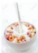
leche con cereales