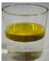
agua con aceite