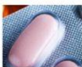
pastillas para la gripe