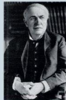
Thomas Alva Edison

Hoy en día se siguen utilizando este tipo de bombillas, pero debido a la gran cantidad de energía que consumen serán sustituidas por las bombillas fluorescentes de bajo consumo.