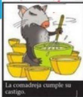
La comadreja cumple su castigo.

La comadreja cumple un castigo ejemplar en la comisaría. Debe batir bizcochuelo y limpiar el suelo.