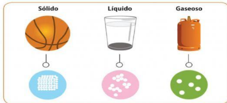
Estados de agregación.

ACTIVIDAD N°1: Selecciona las características correctas de cada estado de la materia.