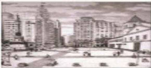
Paisagem (1 )