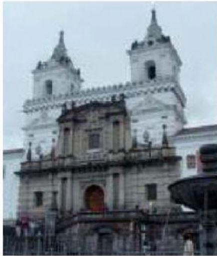
Adavyd. Wikimedia Commons.

2. ¿Qué características tienen los edificios más importantes de la Colonia y de la actualidad?