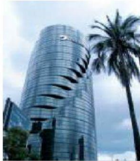
H3kt0r. Wikimedia Commons.