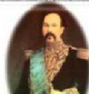
Ignacio de Veintimilla