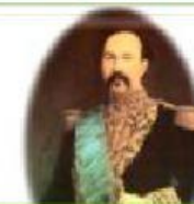
Ignacio de Veintimilla