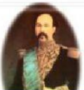
Ignacio de Veintimilla