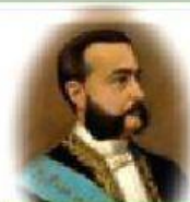
José María Plácido Caamaño