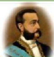
José María Plácido Caamaño