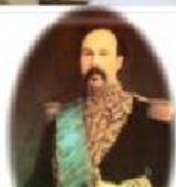
Ignacio de Veintimilla