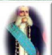
Luis Cordero Crespo

Al fin de mi mandato, intenté proclamarme jefe supremo nuevamente , pero los liberales que me habían apoyado me derrocaron, con la colaboración de las Fuerzas Armadas .