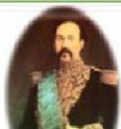
Ignacio de Veintimilla