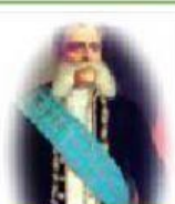
Luis Cordero Crespo

En 1888 , asumí la presidencia , soy hijo de Juan José Flores. Mi programa de gobierno mejoró la instrucción pública, apoyé la inmigración extranjera, mejoré las comunicaciones y recuperé el crédito público.