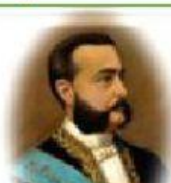
José María Plácido Caamaño