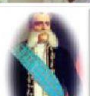
Luis cordero Crespo

Mi gobierno se caracterizó el abuso de poder y los fondos públicos , ineficiencia, corrupción administrativa, el anticlericalismo, la persecución mis opositores, falta de obras públicas, el deterioro de las existentes y la disminución de las rentas dedicadas a la educación y salud.