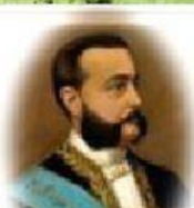
José María Plácido Caamaño