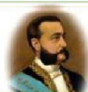
José María Plácido Caamaño