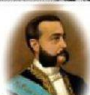
José María Plácido Caamaño