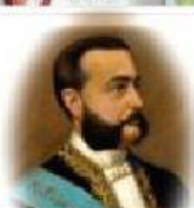
José María Plácido Caamaño