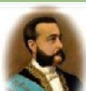
José María Plácido Caamaño