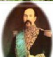
Ignacio de Veintimilla