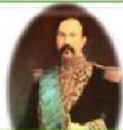
Ignacio de Veintimilla