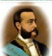
José María Plácido Caamaño