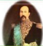
Ignacio de Veintimilla