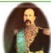
Ignacio de Veintimilla