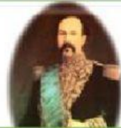
Ignacio de Veintimilla