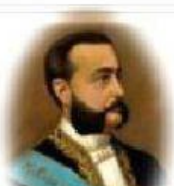
José María Plácido Caamaño