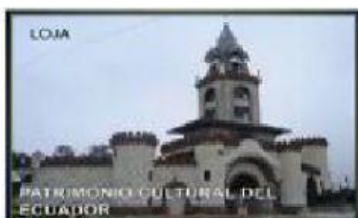
PUERTA DE LA CIUDAD